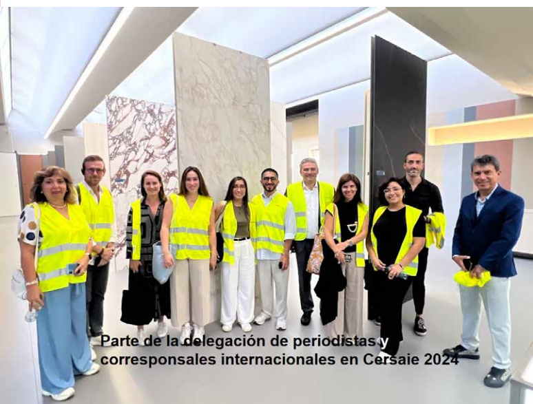
Parte de la delegación de periodistas y corresponsales internacionales en Cersaie 2024

características distintivas, como la sostenibilidad y el respeto de los derechos de las personas, aunque tengamos que hacer frente al dumping cada vez más agresivo de algunos países y a la pérdida de competitividad de nuestras empresas derivada de la aplicación ideológica de normativas, como el ETS, que también persiguen los objetivos ambientales de la UE, dignos de ser adoptados.