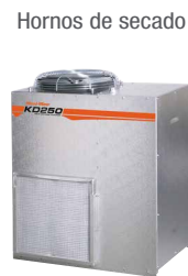
Hornos de secado