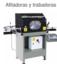
Afiladoras y trabadoras