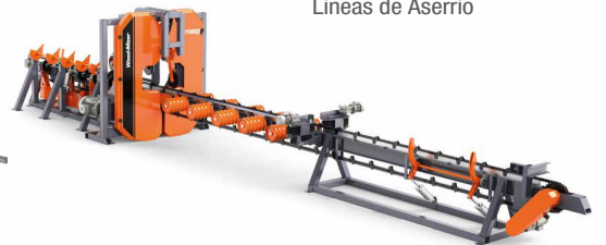
Lineas de Aserrío