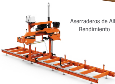
Aserraderos de Alto Rendimiento