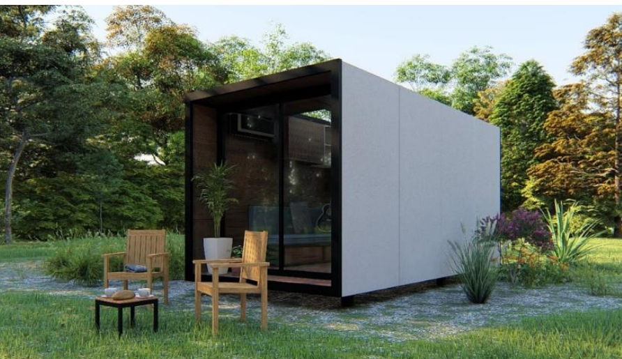
Diseño de micro vivienda en Bolivia

dad de vivienda. Tanto dentro como fuera de las zonas metropolitanas la elección por adquirir una micro vivienda ha aumentado en los últimos años, derivado a encontrar un estilo de vida más simple, sostenible y amigable con el medio ambiente, pero sobre todo siendo una creativa solución para problemas de espacio en grandes ciudades con un gran número de habitantes.