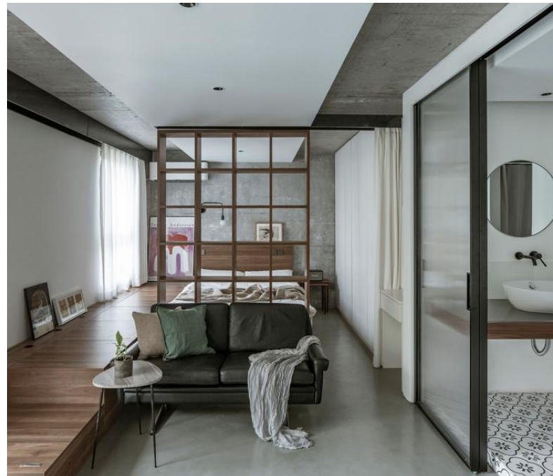
Diseño interior de micro vivienda en China

La micro vivienda surge como un movimiento a finales del siglo XX como una corriente del minimalismo, siendo una propuesta al constante incremento del precio de la vivienda y reduciendo a lo esencial el número de espacios y cantidad de metros cuadrados de construcción teniendo como objetivo la cali-