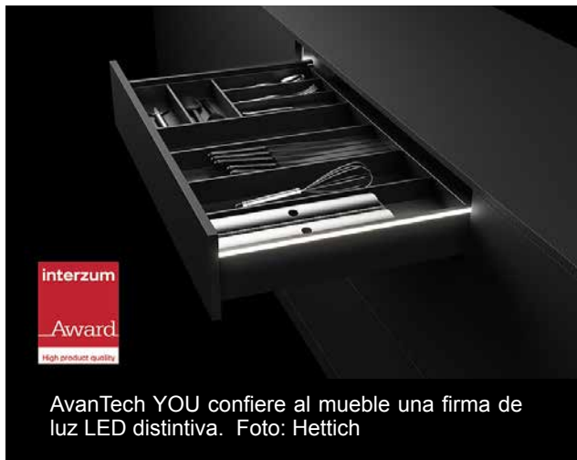
AvanTech YOU confiere al mueble una firma de luz LED distintiva.

El premio destaca especialmente las excelentes prestaciones de diseño en cuanto a la forma y funcionamiento de AvanTech YOU. El estrecho costado de solo 13 mm con función de ajuste de frente integrada de forma invisible permite un diseño elegante e impecable en cualquier combinación.