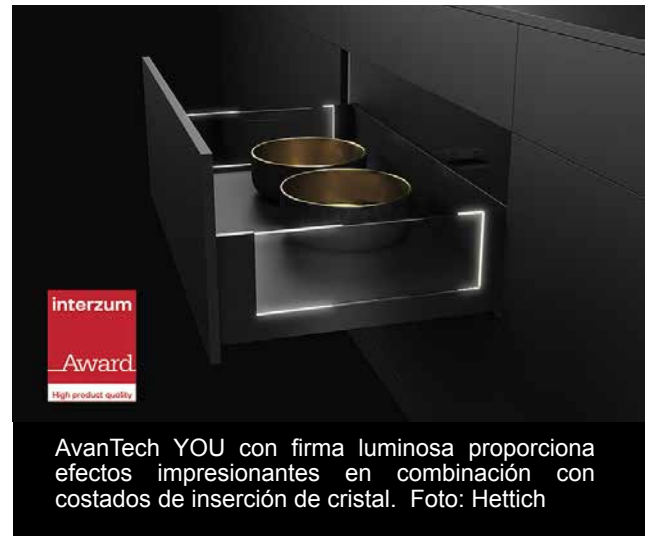
AvanTech YOU con firma luminosa proporciona efectos impresionantes en combinación con costados de inserción de cristal.

La luz se puede integrar también de manera elegante y sencilla. Se trata de una luz LED homogénea en 4.000K integrada en un perfil de diseño que se puede encajar fácilmente e ilumina indirectamente los cajones abiertos desde el interior o produce un destello hacia el exterior.